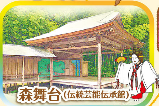
森舞台(伝統芸能伝承館)